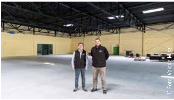
1) Foto: Valerie Misz