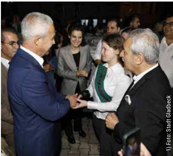
1) Foto: Stadt Gladbeck