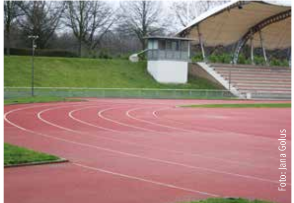
Die marode Tartanbahn im Stadion musste in den letzten Jahren immer wieder von der Stadt ausgebessert werden.