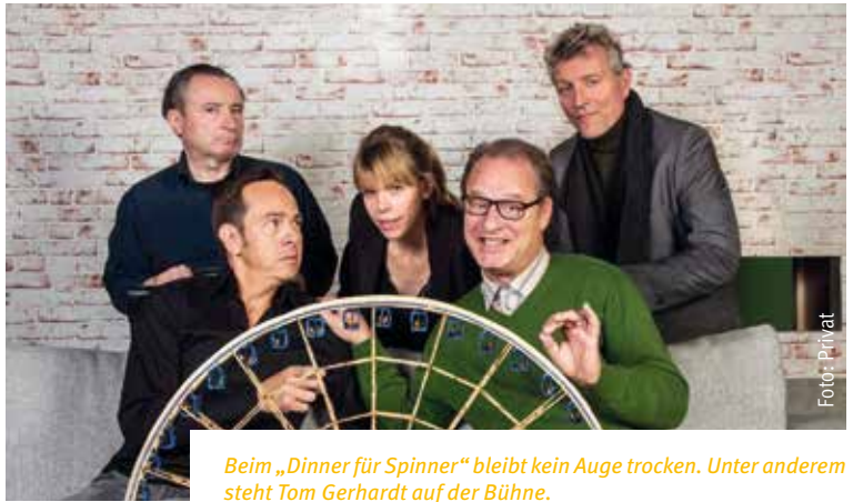
Beim „Dinner für Spinner“ bleibt kein Auge trocken. Unter anderem steht Tom Gerhardt auf der Bühne.

Seine unzähligen erfolgreichen Ohrwurm-Hits wie „Dein ist mein ganzes Herz“, „Lola“, „Mit Leib und Seele“, „Alles was sie will“ oder „Wenn du nicht wiederkommst“ machten ihn berühmt und zu einer der Koryphäen deutschsprachiger