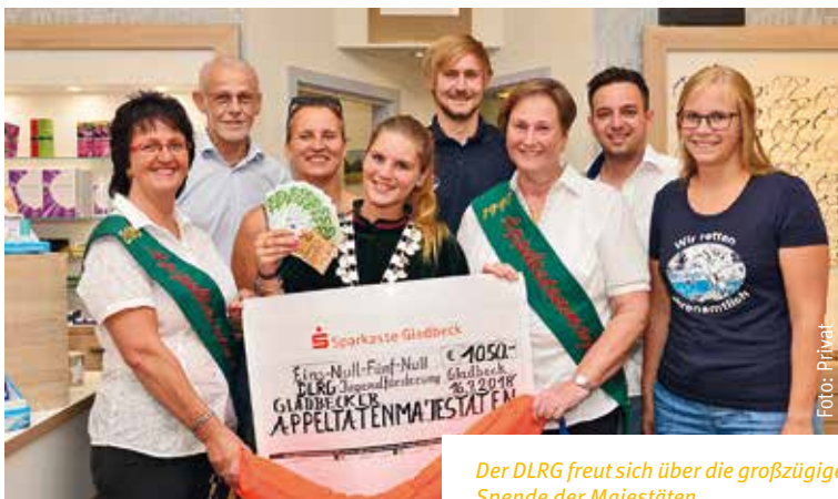
Der DLRG freut sich über die großzügige Spende der Majestäten.

Die Spende fließt in den Material- kauf für die Programmgestaltung. Zum Beispiel benötigt der DLRG Verbandsmaterial, Schienen usw., um eine Unfallverletzung darstellen zu können.