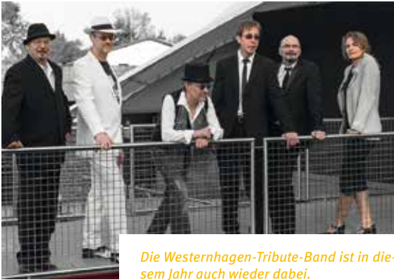
Die Westernhagen-Tribute-Band ist in diesem Jahr auch wieder dabei.