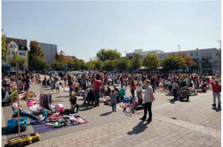
Auch in diesem Jahr hat das Appeltatenfest viele Höhepunkte zu bieten.