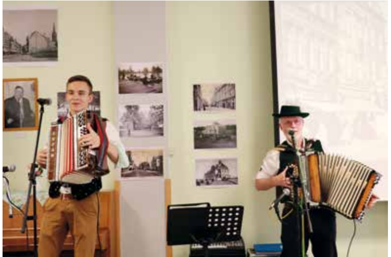
Musik und alte Fotos sorgten für die richtige Atmosphäre an diesem Nachmittag..

musste, ließ er es nicht nehmen, etwas später als Überraschungsgast noch vorbeizuschauen.