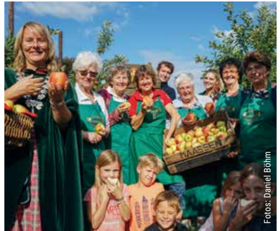
Mit viel Unterstützung pflückten die Majestäten die Gladbecker Äpfel für das große Fest.

Selbstverständlich sind auch die Gladbecker Äpfel zum Probieren und Kaufen auf dem Erntezug mit dabei. Ein zweiter Stand wird neben den Appeltatenmajestäten vor Optik Rodewald stehen. An diesem Stand wird der frisch gepresste Apfelsaft zum Genießen angeboten und natürlich