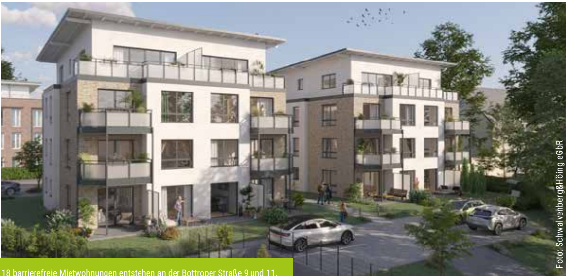
18 barrierefreie Mietwohnungen entstehen an der Bottroper Straße 9 und 11.