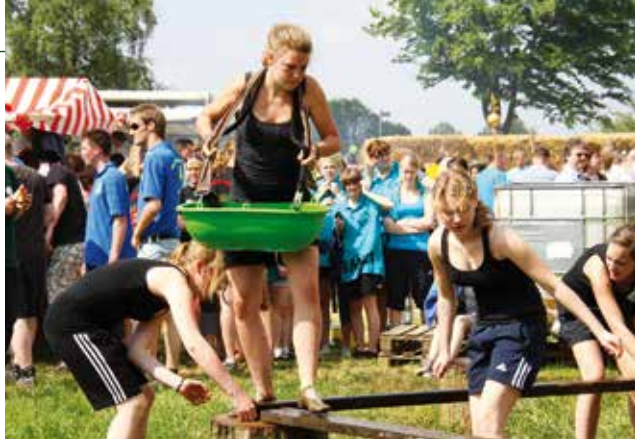
Auch bei der zehnten Olympiade in Kirchhellen wird Wasser eine große Rolle spielen.

Die damaligen Teams waren bei den Damen: „Die Pudelmützen“, „Die Holzwürmer“, „Die verdorbenen Strolche“, „Die wilden Mücken“, „Die kleinen Strolche“ und „Die Runkugeln“; die Herren waren mit „Die Pichelsteiner“, „Die Bengels“, „Die Krümmels“, „Die Niemals Dagewesenen“, „Herrenabend“, „Fall um“, „Die flotten Jungs“, „Die schwatten Hampiepen“, „Die Schlümpfe“, „Et Rappel“, „Die Standfesten“, „Volles Rohr“ und „Die Miegenpöhlen“ dabei. Damals war es noch eine eintägige Veranstaltung, die „Die Holzwürmer“ und „Die Pichelsteiner“ gewannen. Die Olympiade endete abends mit einem zünftigen Scheunenfest, auf dem die