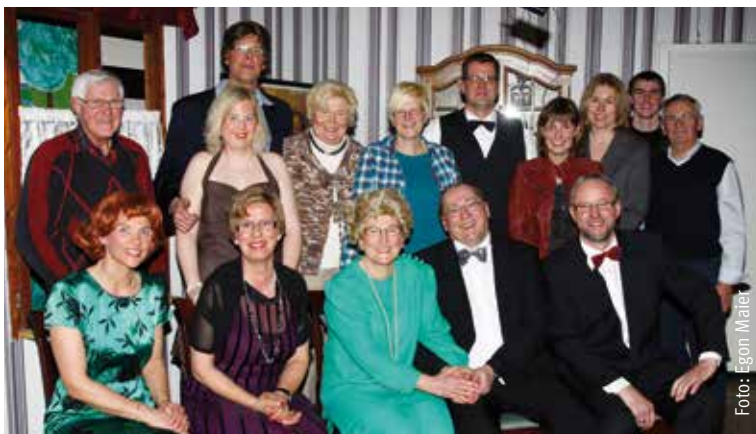
Die Schauspieler des Kolpingtheaters haben wieder einmal für zahlreiche Lacher gesorgt – das Publikum dankte es ihnen.