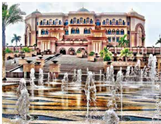
Das Emirates Palace Hotel ist eines der teuersten, luxuriösesten und spektakulärsten Hotels der Welt.

Um die Sehenswürdigkeiten Dubais zu erkunden, braucht es zunächst ein wenig Geduld. Denn an die Landung in der größten Stadt der Vereinigten Arabischen Emirate schließt sich direkt der erste Tag auf hoher See an. Daher bietet sich erst am Ende der Kreuzfahrt die Gelegenheit, die Museen, Gebäude und schönen Plätze der Stadt zu erkunden. Zunächst gilt es,