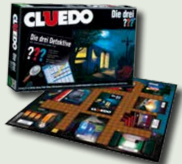
„CLUEDO – Die drei Fragezeichen“

der betreffenden Karten, muss er sie heimlich zeigen. Auf dem beiliegenden Notizblock sollte man sich dann die Information eintragen. Auch die Verdächtigen sind für die drei Fragezeichen alte Bekannte aus Rocky Beach. Ist etwa die schöne Brittany die Diebin oder Dauerrivale „Skinny“ Norris? Der überhebliche Detektiv Dick Perry oder der gerissene Kunstdieb Victor Hugenay? Oder gar der schmierige Journalist Wilbur Graham oder Unterweltboss Mr. Grey? Finden Sie es heraus! Gehen Sie mit den drei Fragezeichen und ihren Freunden der Sache auf den Grund. Ermitteln Sie: Welcher der sechs Gegenstände wurde wirklich gestohlen? An welchem Ort wurde er versteckt? Und wer hat den Diebstahl begangen? Erst wenn Sie die notwendigen Indizien gesammelt haben und per Ausschlussverfahren die Lösung vor Augen haben, sollten Sie Anklage erheben. Dann haben Sie entweder gewonnen oder sich als Spürnase ganz schön blamiert.