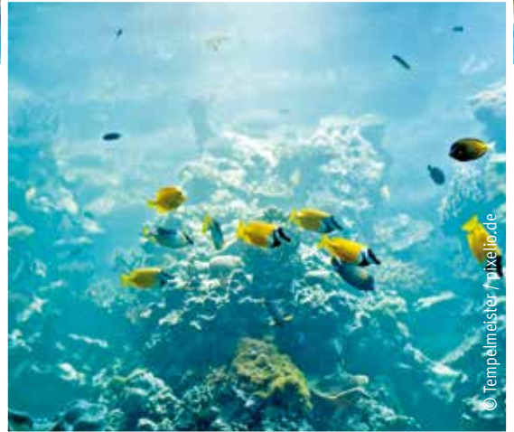
Die faszinierende Unterwasserwelt beeindruckt nicht nur Taucher, sondern zieht alle Besucher in ihren Bann.