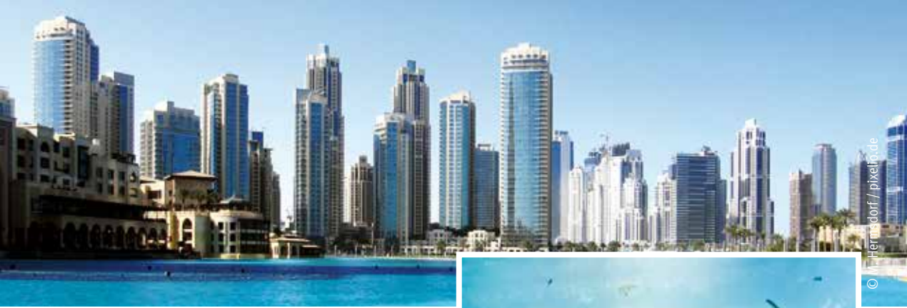
Eine atemberaubende Skyline wartet auf die Ankömmlinge in Dubai.

Wer viele neue Eindrücke gewinnt und viele Unternehmungen hinter sich hat, benötigt auch eine Stärkung. Dafür ist es sowohl möglich, in die örtlichen Restaurants einzukehren, doch hält auch das Schiff einige kulinarische Köstlichkeiten bereit. „In der Reise sind die Mahlzeiten in zahlreichen, auf dem Schiff integrierten Restaurants inbegriffen. Außerdem besteht die Möglichkeiten, einige Besonderheiten, wie zum Beispiel die Sushi-Bar, gegen einen Aufpreis zu nutzen“, so Homann. Demnach bescheren nicht nur die Besuche in den faszinierenden Städten einen einzigartigen Urlaub, auch der Aufenthalt auf dem Schiff wird zu einem unvergesslichen Erlebnis. mh