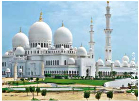
Die Sheikh Zayed Grand Moschee ist die weltweit größte Moschee – ein Besuch ist ein absolutes Muss.