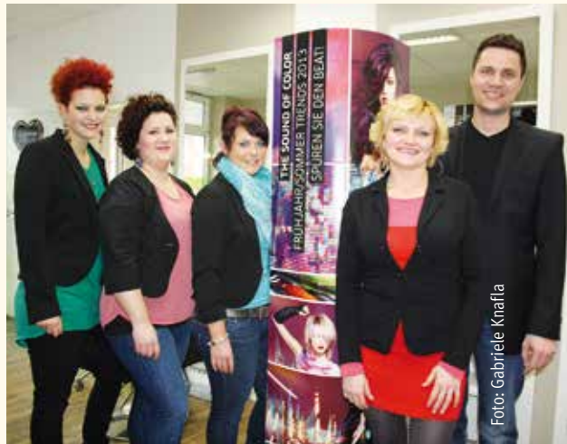
Das Team von COLORS.HAIRDESIGN setzt ab sofort eine neue Strähnenteknik ein.