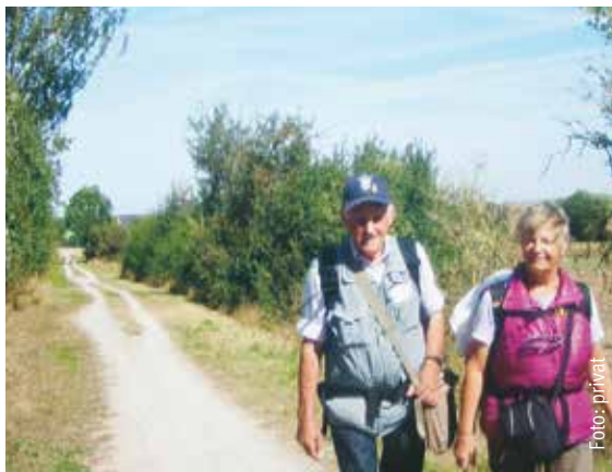
Beim Wandern können die Jendrals die Natur genießen. Hier sind sie gerade auf dem Weg von Feuchtwangen nach Dinkelsbühl.

Geheimnisvolles.“ Eines Tages möchte er noch einmal zum Kloster Kreuzberg zurückkehren – wegen starkem Regen war der Ausblick auf die Wasserkuppe beim ersten Besuch getrübt.