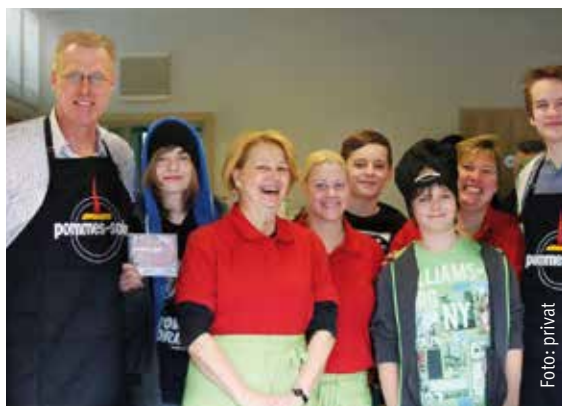
Zur Eröffnung von Burger & more war die Pommies Soko in Kirchhellen zu Gast.

gehört. Dort produziert der Schüler aus Schermbeck schon seit seiner Kindheit kleine Hörspiele.