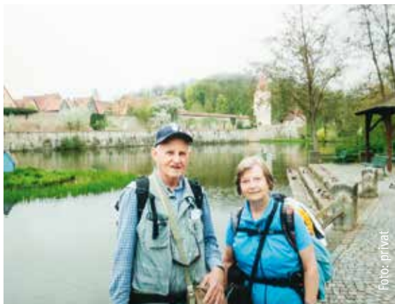
In Dinkelsbühl konnten die Kirchhellener die alte Stadtmauer bestaunen.