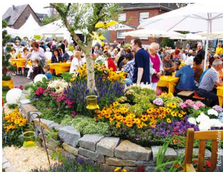
Am Rande der Landpartie kam es in diesem Jahr zu zwei Überfällen auf drei Kirchhellener Männer, die zu Aufregung im Dorf führten.

Unter www.riegelvor.nrw.de kann man unverbindlich erfahren, welche Sicherungsmöglichkeiten es für Türen und Fenster gibt. Die Polizei NRW bietet außerdem Ortsbegehungen an und hilft bei der Planung von Sicherungssystemen.