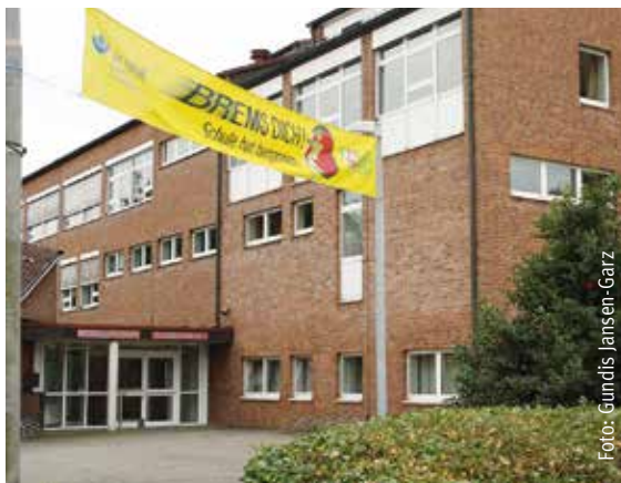
Sehr zum Ärger einiger Nachbarn sind einige Jugendliche, die sich an der Hauptschule treffen in den Ferien auffällig geworden.

Im Zuge dieser Vorfälle wurde auf facebook in der Gruppe „Wir sind Kirchhellen“ heftig diskutiert. Besonders der Wunsch nach mehr Sicherheit in der Nacht wird dabei deutlich. „Die Polizei müsste mehr Streife fahren“, schreibt eine Nutzerin im sozialen Netzwerk. Gleichzeitig wurde die Seite „Kirchhellen Watch“ eingerichtet mit dem Ziel, ein Auge aufeinander und auf Kirchhellen zu werfen: „Es werden unbescholtene Bürger grundlos verprügelt, unzählige Einbrüche verübt und sinnloser Vandalismus gehört bald zum traurigen Alltag“, heißt es in der Gruppenbeschreibung. Als Bürgerwehr verstünde man sich nicht – „höchstens als Bürgerwacht“.