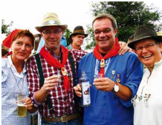
Die Brezelmajestäten ließen es sich natürlich nicht nehmen, mit auf die Runkeln zu werfen – für Zielwasser sorgen sie selbst.