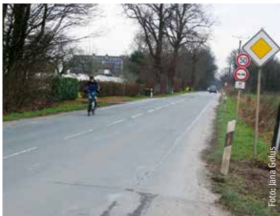
Radfahrer sieht man hier besonders in den dunklen Wintermonaten schlecht.