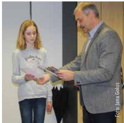
Kurz & Knapp