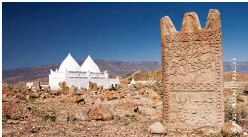
Schroffe und karge Felsen, wechseln sich mit grünen Gärten ab. Oman ist ein Land der Gegensätze.

In den Erzählungen von „1001 Nacht“ und im Koran rankt sich die Geschichte um die reiche Oasenstadt Ubar. Bei Ausgrabungen, die Ruinen einer Festung, grie-