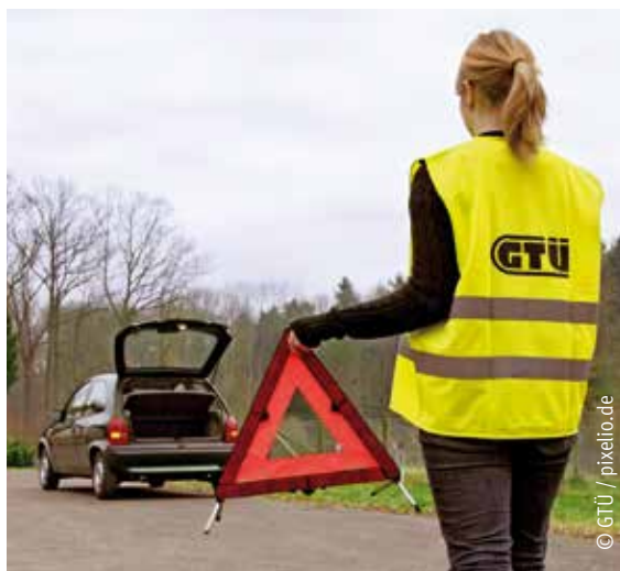
Die Warnweste wird ab Juli in allen deutschen Autos zur Pflicht.