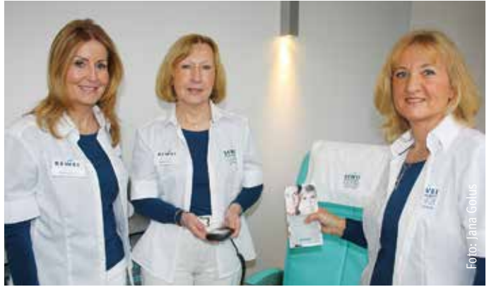
Die Mitarbeiterinnen der BEWEI Body & Beauty Lounge verhelfen Ihnen zu einem gepflegten Äußeren.