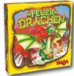
Feuerdrachen Verlag: Haba Alter: 5 bis 99 Jahre Preis: ca. 24,99 Euro

Bei Feuerdrachen werden die Spieler zu Drachenreitern und begeben sich auf den Weg zu Rubino. Dabei müssen sie taktisches Geschick und Würfelglück beweisen, um den Vulkan zu ziehen und versuchen, die begehrten Drachenrubine einzusammeln. Wer am Ende die meisten Rubine in seinem Säckchen hat, gewinnt das Spiel. Das Spiel ist ein explosiver Sammelwettbewerb um den Vulkan für zwei bis vier Spieler im Alter von fünf bis 99 Jahre. Die Spieldauer beträgt etwa 15 bis 20 Minuten.