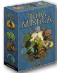
Terra Mystica Verlag: Feuerland Alter: ab 12 Preis: ca. 59,90 Euro

Zwei bis fünf Spieler ab 12 Jahre können bei diesem spannenden Strategiespiel mitmachen.