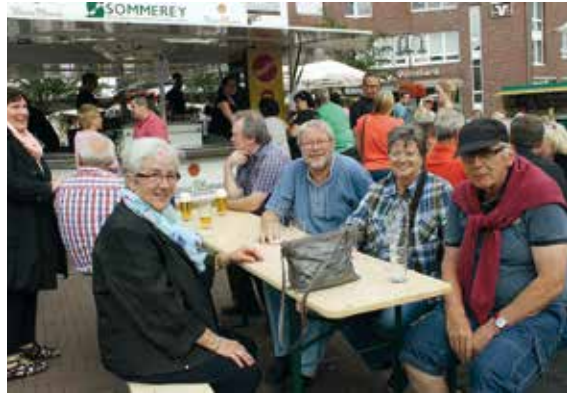
Auf dem Kirchhellener Feierabendmarkt trifft man sich auf dem Johann-Breuker-Platz.