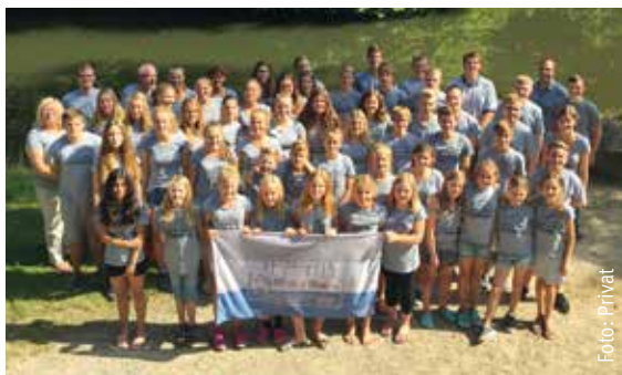
Bei der KjG-Ferienfreizeit werden Spaß und Gemeinschaft großgeschrieben.

Beim gemeinsamen Infoabend werden die vier Ferienfreizeiten genauer vorgestellt und es besteht die Möglichkeit, Fragen zu stellen. Der Infoabend findet statt am Dienstag, 8. November, um 19.30 Uhr im Pfarrheim St. Johannes der Täufer. Anmeldungen werden am Samstag, 3. Dezember, zwischen 9 Uhr und 10 Uhr im jeweiligen Pfarrheim entgegen genommen. Dazu sind 100 Euro Anzahlung sowie die Unterschrift eines Erziehungsberechtigten erforderlich.