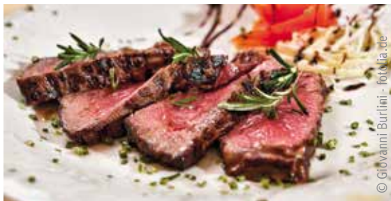
Die Genießerwochen bei der Bio-Metzgerei Scharun starten im November.

Zuhause frisch genießen können Sie mit dem Catering von Scharun. „Für unsere Partyservice-Speisen verwenden wir ausschließlich unser hauseigenes Biofleisch und frische Produkte aus der Region“, betont der Biometzger. Ob in kleinem oder großem Rahmen, von der Privatfeier bis zum Großevent ist hier alles möglich. Die Kunden haben stets die Wahl zwischen Finger-Food, Buffet, einem Life-