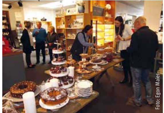
Auf ein Stück Kuchen bei Timmerhaus – Das Team freut sich auf Ihren Besuch.

In gemütlichem Ambiente haben die Kunden an dem Samstag die Möglichkeit, sich schon einmal für Weihnachtsgeschenke inspirieren zu lassen. In der wunderschönen Wohnwelt bei Timmerhaus entdecken Sie mit Sicherheit neue Lieblingsstücke für Bad, Küche und Wohnbereich, die auf Ihrem persönlichen Wunschzettel nicht fehlen dürfen. Neben dem großen Sortiment an „schönen Dingen für Zuhause“ dürfen sich die Kirchhellenerinnen und Kirchhellener auf hausgemach-