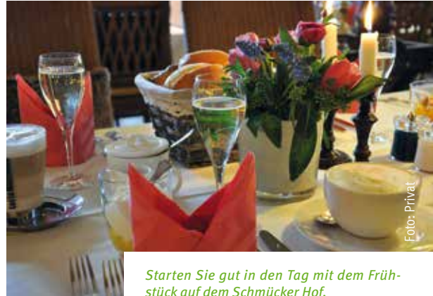
Starten Sie gut in den Tag mit dem Frühstück auf dem Schmücker Hof.

Das klassische Frühstücksbuffet wird in diesem Jahr zum ersten Mal bis zum 11. April durch viele besondere Spezialitäten ergänzt. Beginnen Sie den Tag mit einem Verwöhnfrühstück. Eine abwechslungsreiche Auswahl an Köstlichkeiten wie Vitello tonnato, hochwertige Bergkäse-Variationen, hausgemachte Marmeladen, gebeizter