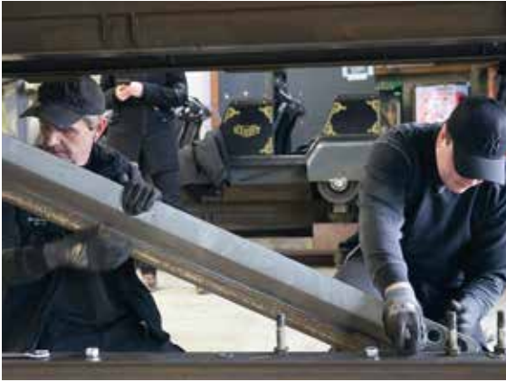
Die Wagen müssen in der Schlosserei geprüft werden und warten dann im Studio 4, bis sie wieder auf die Schienen dürfen.