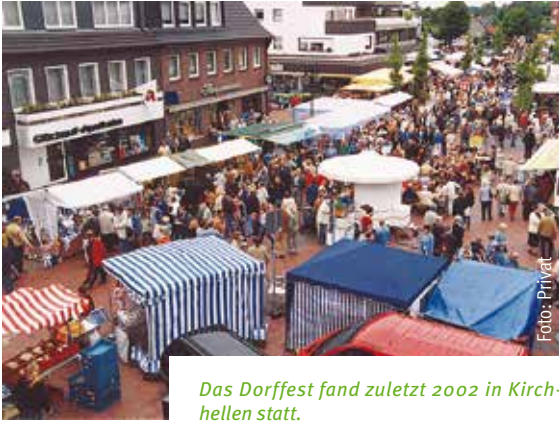
Das Dorffest fand zuletzt 2002 in Kirchhellen statt.

2018 wollen wir einen Termin finden, um dies wieder aufleben zu lassen.