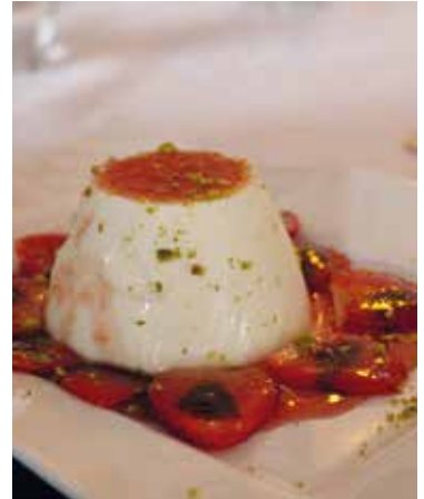
Vorspeise, ein Hauptgericht und Nachtisch werden im Bellini gereicht.