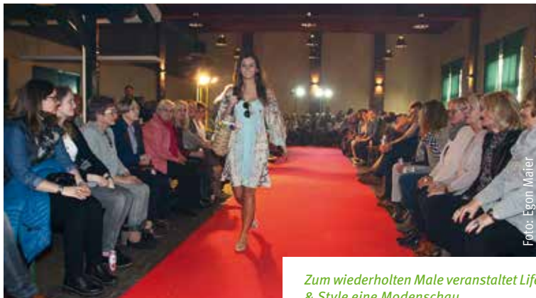
Zum wiederholten Male veranstaltet Life & Style eine Modenschau.

Der Einlass zur Modenschau ist um 14.30 Uhr. Karten für die Modenschau gibt es für vier Euro.