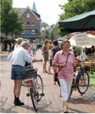
Im November wurde der neue Vorstand der Werbegemeinschaft gewählt.