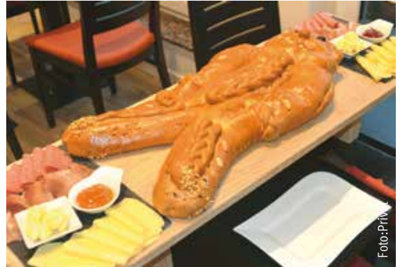
Beim Stutenkerl-Essen steht die Geselligkeit im Vordergrund.