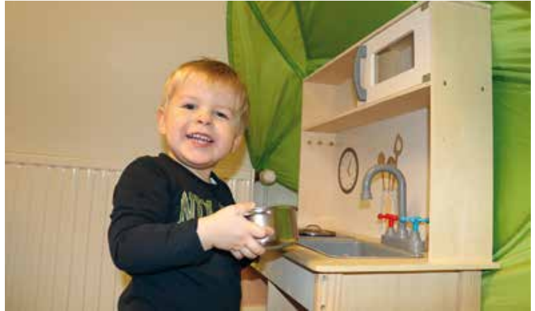
Ob Lesen, Puzzeln, Rollenspiele: Die Kinder der GTP Kirchhellen haben ihren Spaß.