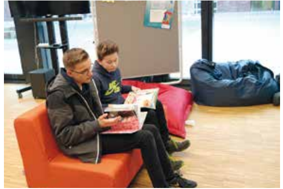
Die Media.lab ist ein Treffpunkt für Kirchhellener Jugendliche.