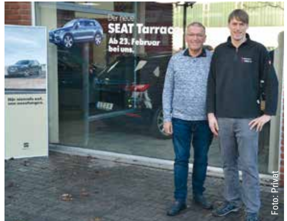
Im Autohaus Bellendorf freut man sich schon jetzt auf das neue SEAT-Modell und die Reaktionen der Besucher am 23. Februar.

Außerdem ist ein buntes Programm geplant. Neben einer Tombola und Live-Musik dürfen sich die Gäste auf weitere Attraktionen und kleine Überraschungen freuen. Auch für das leibliche Wohl wird an dem Samstag gesorgt. Das Team des Autohauses Bellendorf freut sich auf ein buntes Familienfest.