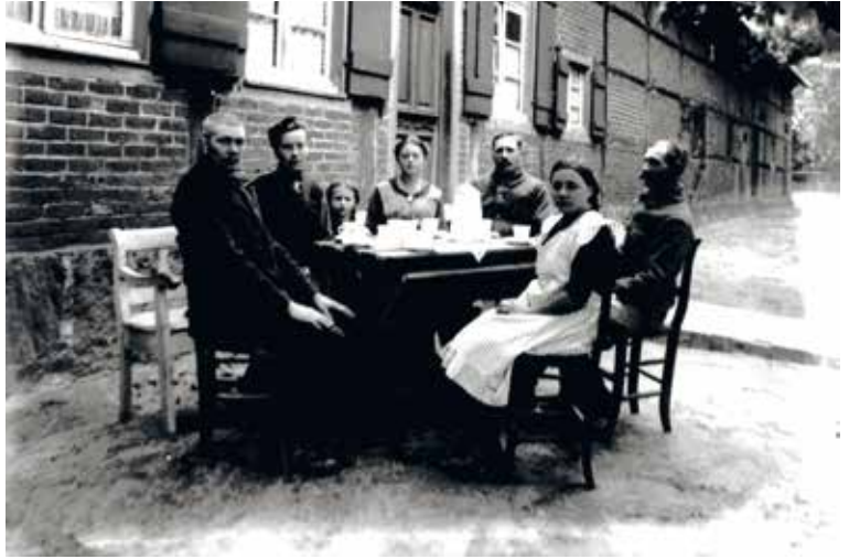
Familienaufnahmen damals: eine aufwendige Besonderheit