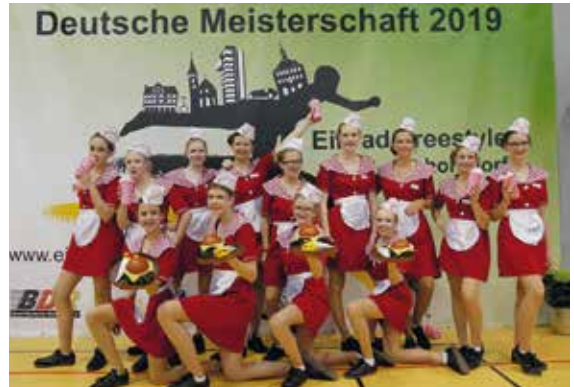
Die beiden strahlenden Sieger der Großen Gruppenküren in der Kategorie U15.

Nach spannenden Wettkampf-Tagen war es Sonntag-nachmittag endlich soweit: die Gruppenküren bildeten den krönenden Abschluss der Deutschen Meisterschaft. Als erste Gruppe des VfL Grafenwald mussten die Bonais aufs Feld. Für ihre perfekte Performance ernteten die Nachwuchssportler einen riesigen Applaus. Und auch die zweite U15-Gruppenkür, die bereits im vergangenen Jahr den Meistertitel mit nach Hause bringen konnte, präsentierte ihre Kür zum Thema „American Diner“ fast fehlerfrei. Eine herausragende Leistung von beiden Gruppen, die mit dem Vize-Titel für die Bonsais und dem Meistertitel für die „American Diner“-Kür belohnt wurde. Damit hätte wohl niemand gerechnet, was die Freude bei allen Beteiligten umso größer machte.