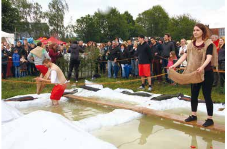
Auch bei der Bauernolympiade 2019 wird den Teilnehmern so einiges abverlangt.