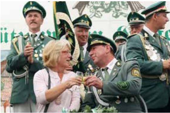
An den besonderen Moment vor zwei Jahren denkt das Kaiserpaar gerne zurück.