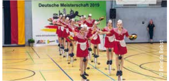
Die Gruppenkür unter 15 Jahre des VfL Grafenwald wurde im Mai erneut Deutscher Meister.