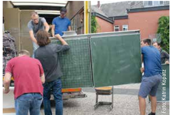
Neben Gartengeräten gingen auch Tafeln für den weiteren Ausbau des Schulgebäudes in Gambia auf große Reise.

Dem Verein „Kinderdorf Bottrop in Gambia e.V.“ gelingt es bereits seit 1985 auch die nächste Generation zu motivieren mitzuhelfen. Unter anderem mit der Möglichkeit, ein