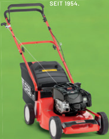
SABO 43-COMPACT SM