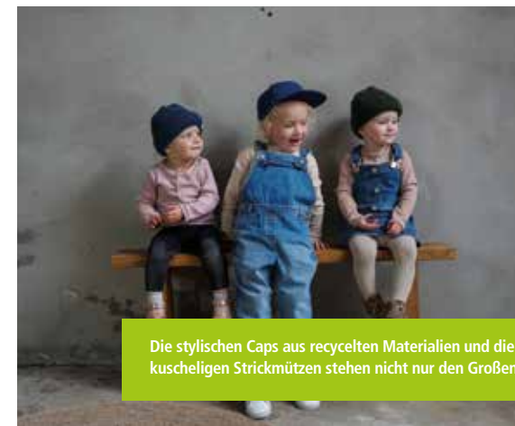
Die stylischen Caps aus recycelten Materialien und die kuscheligen Strickmützen stehen nicht nur den Großen.

Mitspracherecht haben die Kunden allerdings nicht nur was die wohltätige Unterstützung angeht, sondern auch hinsichtlich neuer Farben und Designs. So gab es zum Beispiel im vergangenen Jahr eine besondere Aktion in Form eines „Color-Drops“, bei der die am häufigsten gewünschte Trendfarbe der Kunden für eine limitierte Kollektion berücksichtigt wurde. Auch in Sachen Produktion hat sich einiges getan. Denn ihrem Ziel, die Textilien ausschließlich in Europa zu produzieren, sind die Gründer wieder ein Stück näher gekommen. Für die Herstellung einiger Accessoires gibt es schon jetzt in Deutschland Produk-