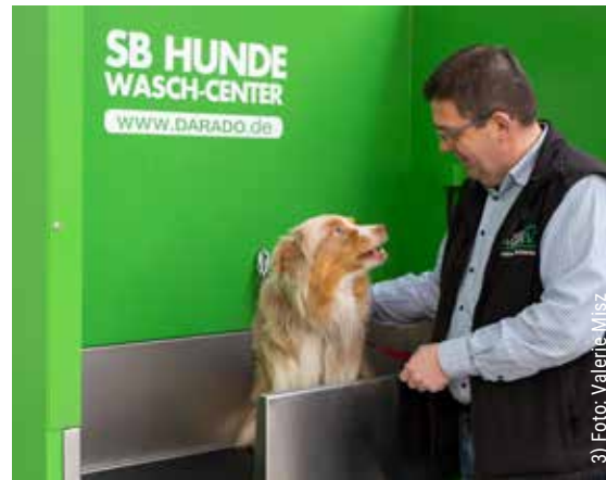
3) Foto: Valerie Nilsz