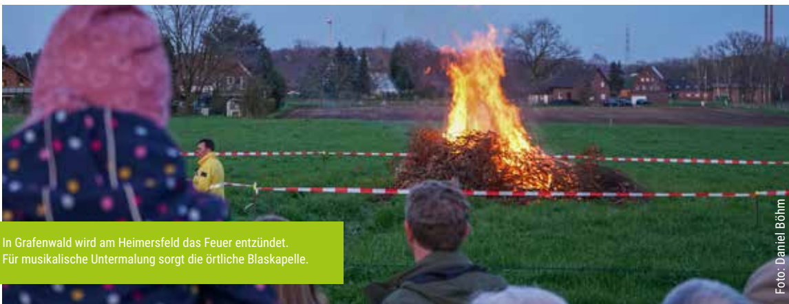
In Grafenwald wird am Heimersfeld das Feuer entzündet. Für musikalische Untermalung sorgt die örtliche Blaskapelle.