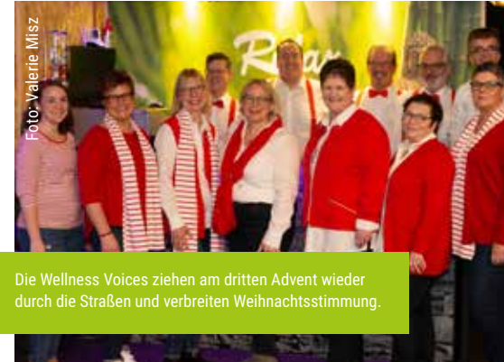
Die Wellness Voices ziehen am dritten Advent wieder durch die Straßen und verbreiten Weihnachtsstimmung.

Der Chor „Wellness Voices“ zieht zum vierten Mal in der Adventszeit durch die Straßen – Mitsingen ist ausdrücklich erwünscht