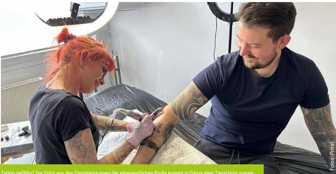
Tattoo gefällig? Der Erlös aus den Dienstleistungen der ehrenamtlichen Profis kommt in Gänze dem Tierschutz zugute.