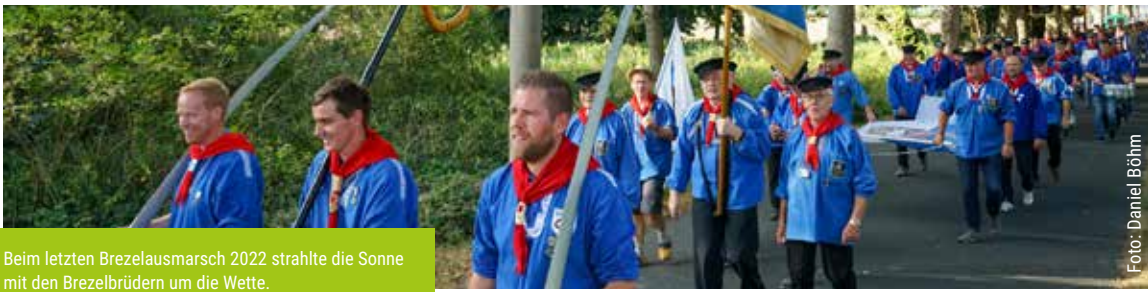
Beim letzten Brezelausmarsch 2022 strahlte die Sonne mit den Brezelbrüdern um die Wette.