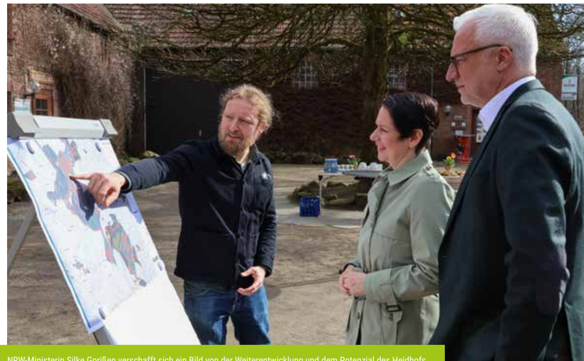
NRW-Ministerin Silke Gorißen verschafft sich ein Bild von der Weiterentwicklung und dem Potenzial des Heidhofs.

Der Gebäudekomplex soll nun als nachhaltiger Lern- und Begegnungsort für zukünftige Generationen gestaltet werden.