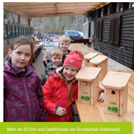
Mehr als 20 Erst- und Zweitklässler der Grundschule Grafenwald haben dieses Mal mit ihren Eltern an der Nistkasten-Aktion teilgenommen.

Am Waldpädagogischen Zentrum wurden fleißig die Hämmer geschwungen: Wie die Kinder den Vögeln bei der Wohnungssuche helfen