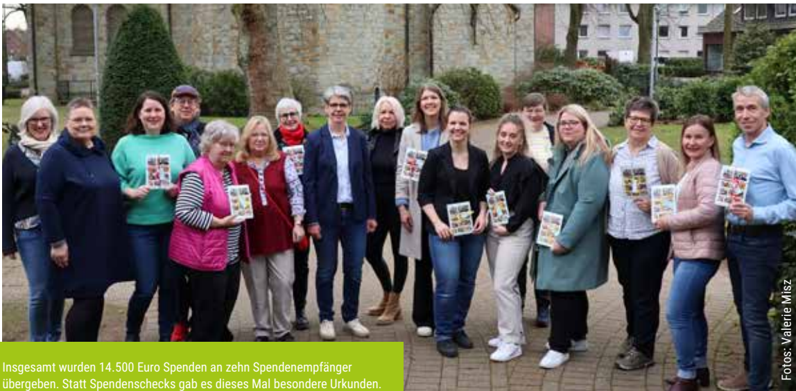
Insgesamt wurden 14.500 Euro Spenden an zehn Spendenempfänger übergeben. Statt Spendenschecks gab es dieses Mal besondere Urkunden.