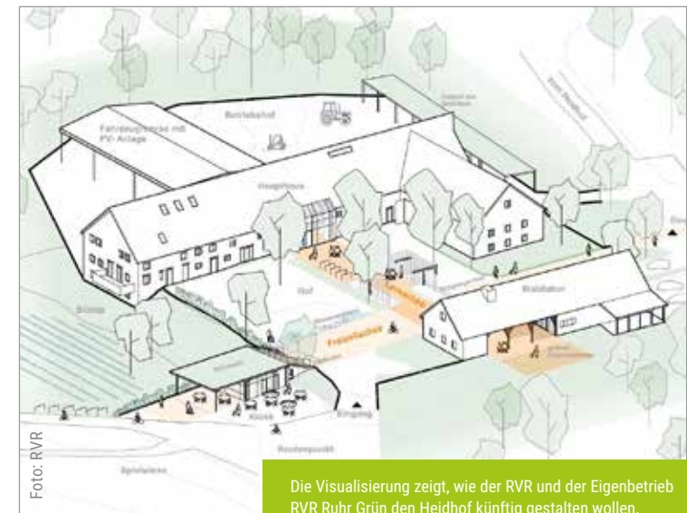
Die Visualisierung zeigt, wie der RVR und der Eigenbetrieb RVR Ruhr Grün den Heidhof künftig gestalten wollen.

schäftliche Unterrichtsräume, verbesserte Arbeitsbereiche für die 15 Mitarbeitenden des Betriebs sowie ein großes Foyer als Informations- und Orientierungspunkt.