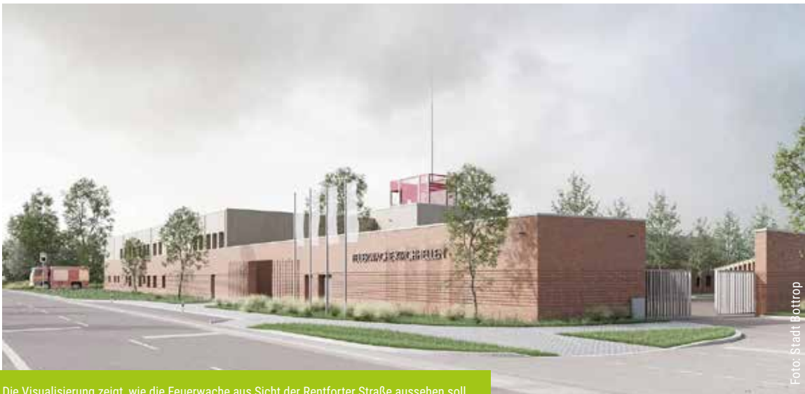
Die Visualisierung zeigt, wie die Feuerwache aus Sicht der Rentforter Straße aussehen soll.