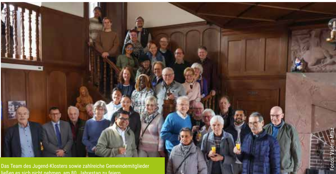
Das Team des Jugend-Klosters sowie zahlreiche Gemeindemitglieder ließen es sich nicht nehmen, am 80. Jahrestag zu feiern.