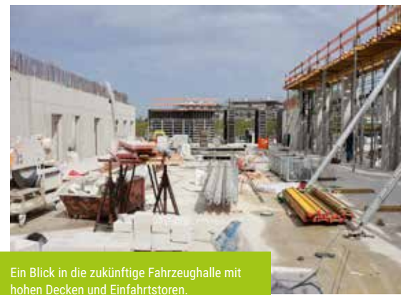
Ein Blick in die zukünftige Fahrzeughalle mit hohen Decken und Einfahrtstoren.

„Seit die Arbeiten am Rohbau gestartet sind, können die Menschen beinahe täglich Fortschritte sehen“, sagt Klaus Müller. Entsprechend positiv seien auch die Rückmeldungen aus der Bevölkerung. Dass es nicht nur schnell aus-