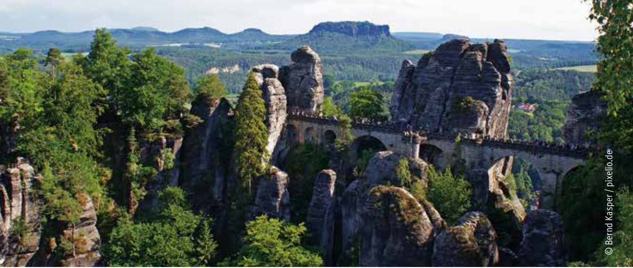
Ausblick auf die bekannte Basteibrücke und im Hintergrund das Wahrzeichen der Sächsischen Schweiz, den Lilienstein.

führt an selbiger entlang. Wenn die Zeit es zulässt, lohnt sich ein Abstecher auf die andere Elbseite. Eine Fähre fährt in regelmäßigen Abständen von einer Uferseite an die andere und entlässt die Passagiere zu einem Besuch des Nationalparks, Heimatmuseums oder Stadtparks.