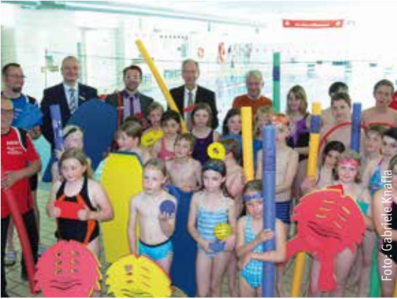
Die Schermbecker Geldinstitute unterstützen den WSV von Anfang an und haben nun dafür Sorge getragen, dass ausreichend Schwimm utensilien vorhanden sind.