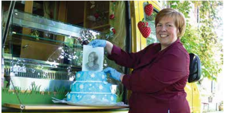
Die Zuckerbäckerin bietet ab sofort auch essbare Fotos an und gibt Torten damit ein individuelles Gesicht.

Als Untergrund für das Foto können die unterschied-