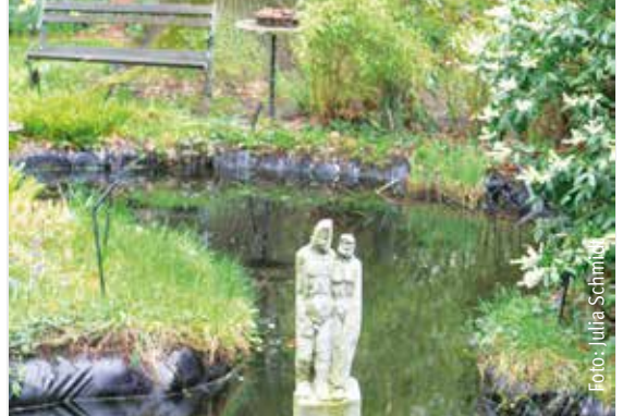
Wie Kunst und Natur zusammenspielen, zeigt sich im Garten der Familie Hagedorn.

Zur 13. Auflage von „Kunst in der Natur“ am Pfingstwochenende wird der Garten wieder einmal zur Freiluft-Ausstellungsfläche, wenn die eingeladenen Künstler ihre Skulpturen aus Stahl, Holz oder Glas präsentieren. Zeitgleich wird auf dem angrenzenden Gelände der Baumschule Wüstemeyer Kunsthandwerk ausgestellt – im Gewächstunnel, zwischen immergrünen oder bei den gerade in der Hochblüte stehenden