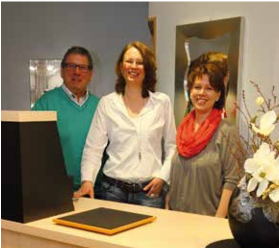
Das bewährte Team freut sich über die Renovierung.

Mit Trollbeads und Fossil werden weiterhin die beliebten Trendmarken angeboten. Wie wäre es beispielsweise mit einem kleinen Präsent zum Muttertag? Da machen sich ein paar Glasbeads am Armband sicher gut.