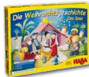
Die Weihnachtsgeschichte – Das Spiel HABA Alter: 4 - 99 Jahre

Die Weihnachtsgeschichte – Das Spiel eignet sich hervorragend als Familienspiel für die Weihnachtszeit. Gemeinsam hören und erleben die Spieler bei diesem Spiel die Weihnachtsgeschichte. Sie begleiten Maria und Josef nach Bethlehem, zeigen mit gutem Gedächtnis den heiligen drei Königen den richtigen Weg und helfen dem Hirten, alle Schafe zur Krippe zu führen. Das Spiel endet, wenn alle das Jesuskind im Stall bei Bethlehem erreicht haben. Ein kooperatives Weihnachtsspiel, das sich für Spieler im Alter von vier bis 99 Jahre eignet und das Wir-Gefühl sowie das Gedächtnis fördert.