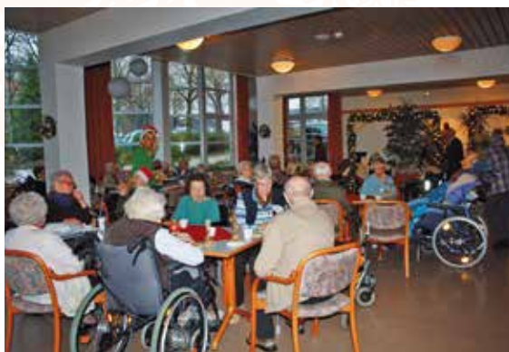
Der Adventsmarkt ist eine Tradition, die in jedem Jahr in der Aula stattfindet und auf große Resonanz bei den Besuchern stößt. In diesem Jahr gab es Reibekuchen und Eierpunsch.

Hauses sorgt reichlich Dekoration für weihnachtliche Stimmung. Im Foyer steht bereits die große Krippenlandschaft, die noch wächst. Von Woche zu Woche kommen mehr Figuren hinzu, bis schließlich Maria und Josef da sind und an Heiligabend das Christkind in der Krippe liegt. „Es muss für die Bewohner nachvollziehbar sein, was im Advent passiert. Deshalb lassen wir uns Zeit.“ Auch ein Adventskalender darf nicht fehlen – der wird in jeder Etage gefertigt und per Losverfahren werden die Päckchen geöffnet. Auch dabei gilt es, an dem anzudocken, wie die Menschen gelebt haben.