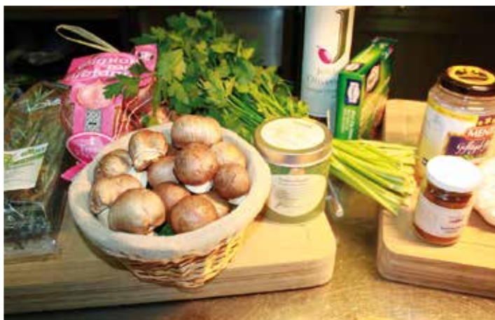
Leckere und frische Zutaten werden für dieses Rezept verwendet.