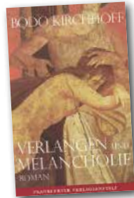
Verlangen und Melancholie Autor: Bodo Kirchoff Verlag: Frankfurter Verlagsanstalt Preis: 24,90 Euro