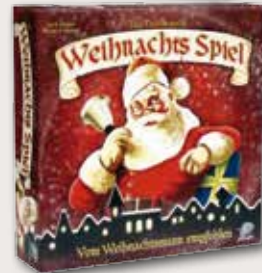
Das traditionelle Weihnachtsspiel Upper Deck Alter: ab sechs Jahre

Das Weihnachtsspiel ist für Spieler ab sechs Jahre geeignet und erfreut die ganze Familie. Fröhliche Weihnachten werden Brettspielfans mit dem unterhaltsamen Weihnachtsspiel haben, das vorweihnachtliche Stimmung nach Hause bringt.