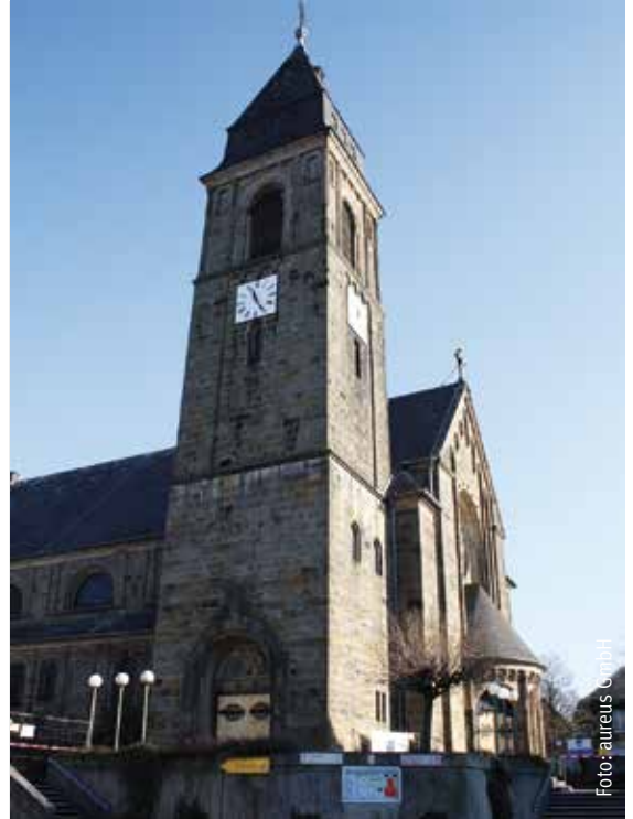
Die St. Ludgerus-Kirche blickt bereits auf eine 100-jährige Geschichte zurück.

Neben dem 100-jährigen Jubiläum der Pfarrkirche feiert die Gemeinde auch das 25-jährige Bestehen der Partnerschaft mit der Pfarrgemeinde „Nuestra Señora de la Paz“ in San Cristóbal, Dominikanische Republik. Eine kleine Besuchergruppe aus der Partnergemeinde ist vom 13. August bis zum 27. August zu Gast in Schermbeck und wird ebenfalls an dem Pfarrfest teilnehmen. kb