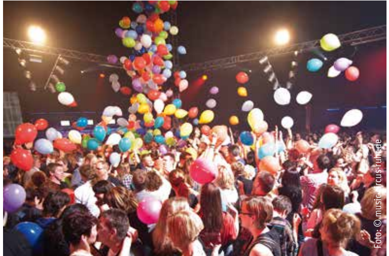
Im Hauptzelt befindet sich die Tanzmanege. Außerdem gibt es eine Cocktailbar, einen Ruhebereich und einen Biergarten.

Der „Tanz in den November“ ist keine Halloweenparty. Das Team vom Music Circus freut sich über jeden Gast – ob verkleidet oder nicht. Gefeiert wird im Music-Circus-