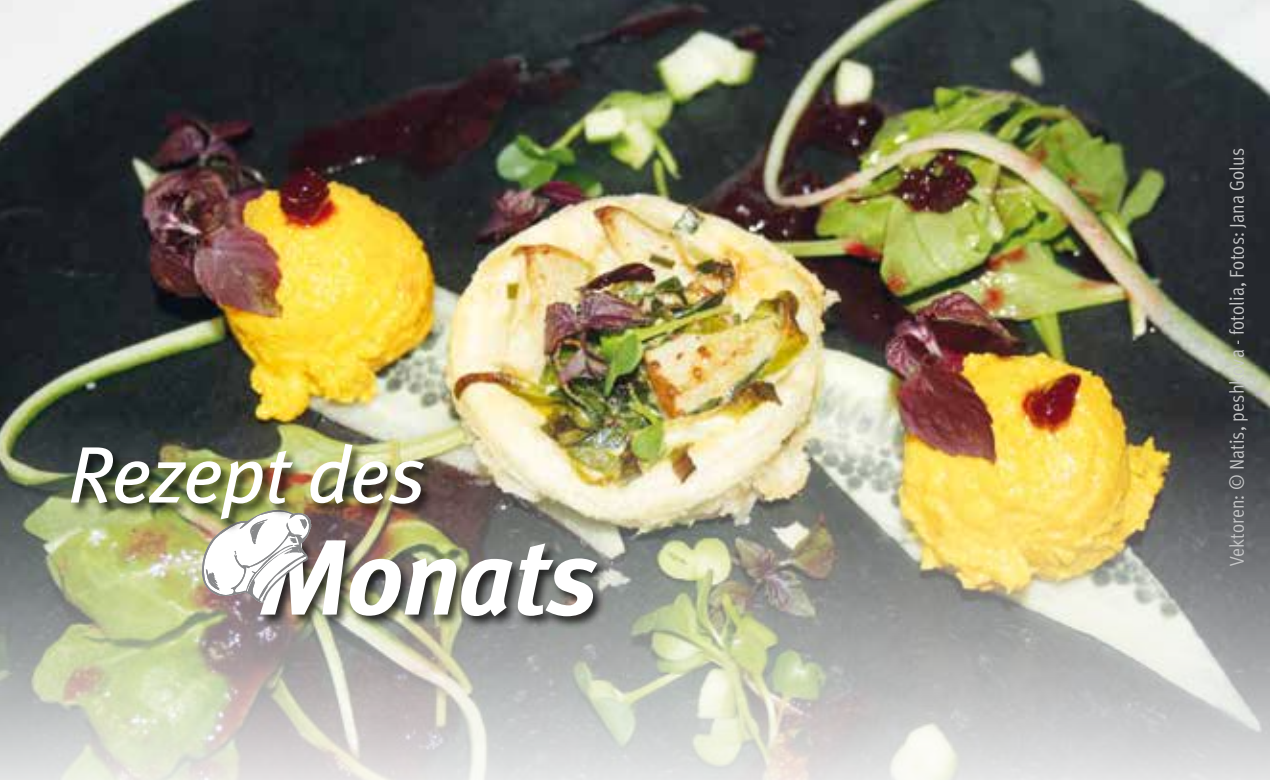
Vektoren: © Natis - pesh / iStockphoto.com - forolia, Fotos: Jana Golus