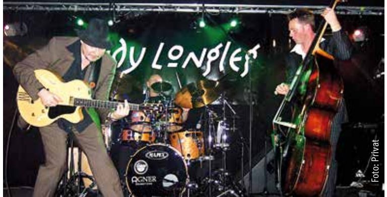
Das Trio Daddy Longleg wird bei der Gaststätte Nappenfeld zu sehen sein.