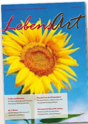
Ihr Oliver Mies