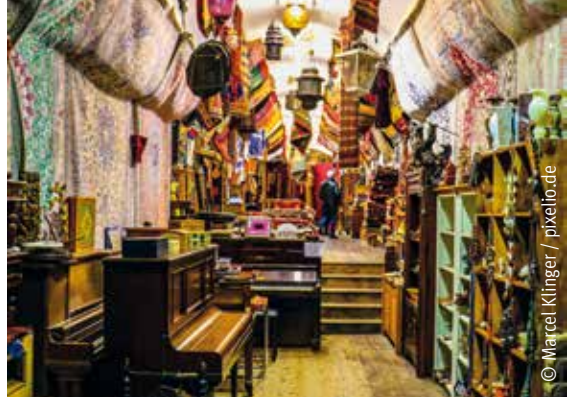
Nicht nur die Londoner Innenstadt hat viel zu bieten, sondern auch im Londoner East End gibt es Spannendes zu entdecken.

Prag ist die Hauptstadt von Tschechien und besticht durch eine einmalig schöne Altstadt. Hier kann man tagsüber einkaufen, was das Portmonee hergibt. Und auch kulturell hat die altertümliche Stadt viel zu bieten. Wer in Prag Urlaub macht, wird um einen Besuch der Karlsbrücke nicht herumkommen. Sie ist eine im 14. Jahrhundert errichtete, historisch bedeutsame Brücke über die Moldau in Prag.