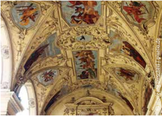
Das prachtvolle barocke Palais Waldstein in Prag wurde für den berühmten Feldherren Albrecht von Wallenstein errichtet.