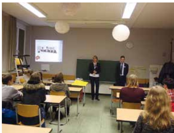
Die Volksbank Schermbeck brachte den Schülern einen genauen Einblick in die Ausbildung zum Bankkaufmann.