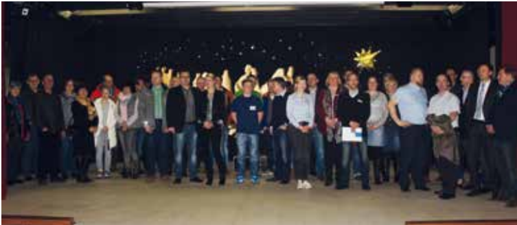
30 Unternehmen aus Schermbeck und Umgebung kamen zum Berufsinformationsabend der Gesamtschule Schermbeck.