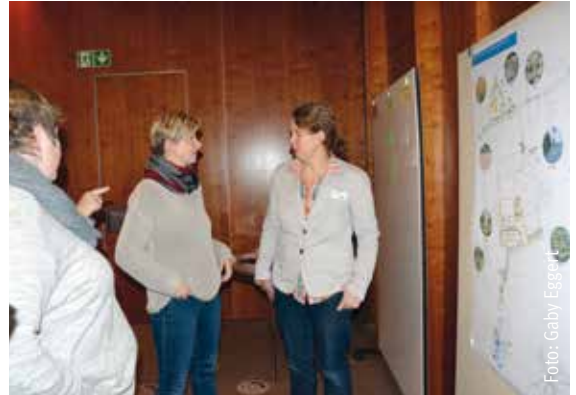
Zu der Vorstellung des Spielplatzkonzeptes kamen nur rund 20 Personen ins Rathaus.