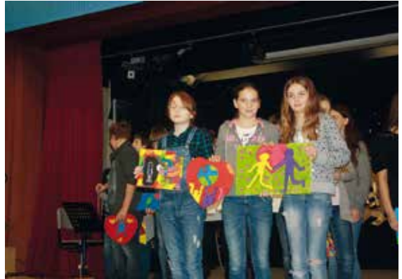
Die bunten Keith Haring Figuren zeigten „Wir leben alle auf einer Welt und bringen verschiedene Farben und Facetten in diese.“