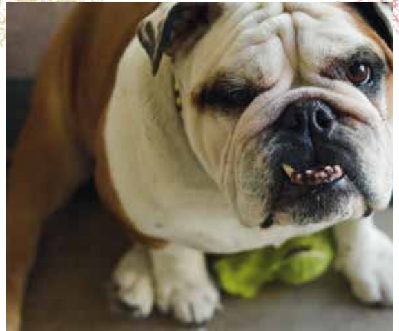
Bruno ist eine liebenswerte Bulldogge mit einem leichten Atemproblem.