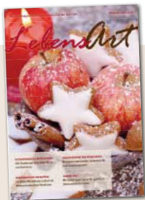
Ihre Katharina Boll

Genießen Sie die besinnliche Adventszeit,