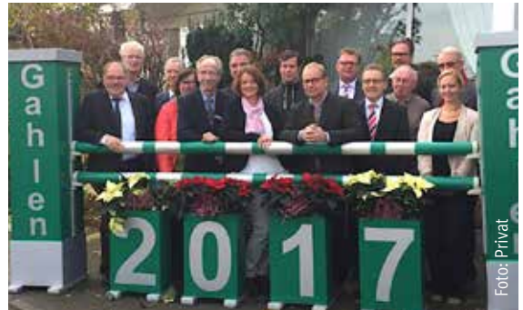
Das gesamte Organisationsteam freut sich bereits auf das traditionelle Hallenreitturnier in Gahlen.

Gahlens Hallenturnier wäre nicht, was es ist, ohne den Ideenreichtum und die Flexibilität seiner „Macher“. Weil es das Raiffeisenmarkt Cup-Finale Springen und Dressur künftig im gleichen Jahr, in dem die Qualifikationen statt-