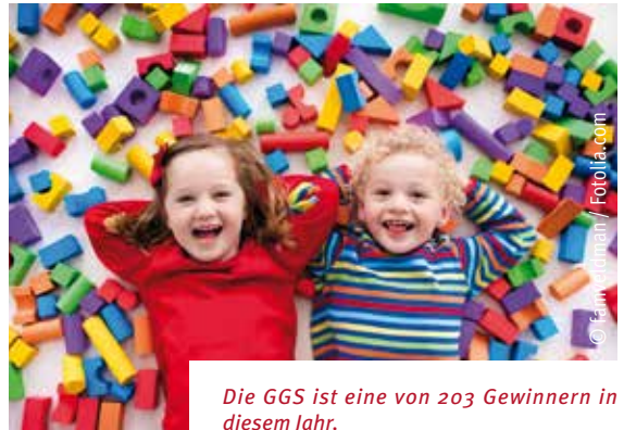
Die GGS ist eine von 203 Gewinnern in diesem Jahr.

„Spielen und Lernen sind keine Gegensätze! Darum sind gute Spiele eine wichtige Ergänzung des schulischen Bildungsangebots. Kinder unterscheiden nicht zwischen Lernen und Spielen, sie lernen beim Spiel“, sagt Prof. Dr. Dr. Manfred Spitzer vom TransferZentrum für Neurowissenschaften und Lernen in Ulm. Die GGS Schermbeck hat sich an dem Aufruf der Initiative bereits im letzten Jahr beteiligt und ein pädagogisches Konzept eingereicht, in dem sie ihre Ideen und Vorstellungen rund um ein Spielzimmer in ihrer Schule vorstellt hat. Insgesamt gibt es in diesem Jahr 203 Gewinner in allen 16 Bundesländern. Die Initiative „Spielen macht Schule“