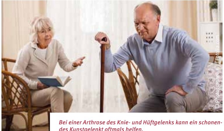
Bei einer Arthrose des Knie- und Hüftgelenks kann ein schonendes Kunstgelenk oftmals helfen.

Die Arthrose des Knie- und Hüftgelenks zählt zu den häufigsten Erkrankungen des menschlichen Bewegungsapparats. Sie führt zu Schmerzen mit Bewegungseinschränkung und somit zum Verlust von Mobilität und Lebensqualität. Durch den Einsatz von Kunstgelenken kann diese Verschleißerkrankung erfolgreich behandelt werden. In Deutschland werden jährlich etwa 380.000 Kunstgelenke des Hüft- und Kniegelenks als Ersatz eines verschlissenen Gelenks eingesetzt.