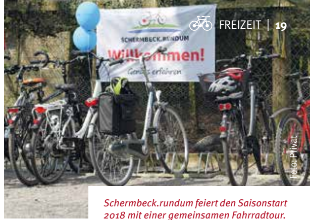
Schermbeck.rundum feiert den Saisonstart 2018 mit einer gemeinsamen Fahrradtour.

Saisonöffnung 2018 der Genussroute SCHERMBECK.RUNDUM – Elf neue Hörstationen in Gahlen – zum ersten Mal auf Plattdeutsch