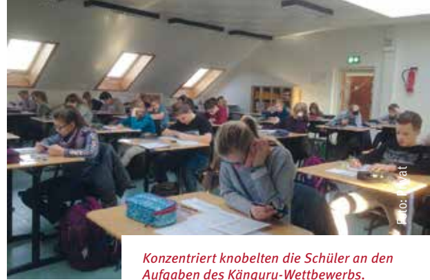
Konzentriert knobelten die Schüler an den Aufgaben des Känguru-Wettbewerbs.

Freiwillig hatten sie sich bei ihren Mathematiklehrern zu einer zusätzlichen Mathematikarbeit angemeldet. Wer sich jetzt die Augen reibt und dies nicht glauben will: Es handelte sich um eine ganz besondere Mathematikarbeit, den weltweiten Wettbewerb „Känguru der Mathematik“, der zu Ehren seiner beiden australischen Erfinder so genannt wird