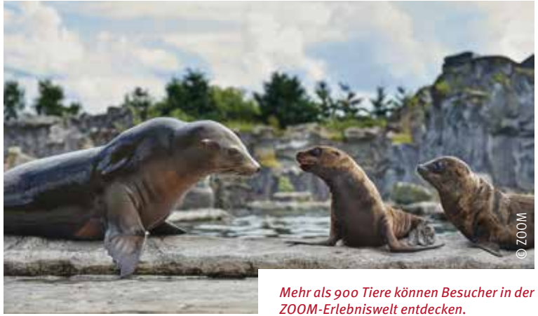
Mehr als 900 Tiere können Besucher in der ZOOM-Erlebniswelt entdecken.

Zahlreiche Veranstaltungen mit zoologischem, kulturellem und spielerischem Programm runden das Erlebnis ab. Der Saisonstart am 1. und 2. April, das Sommerfest im Juli und der Entdeckertag im August locken die ganze Familie.