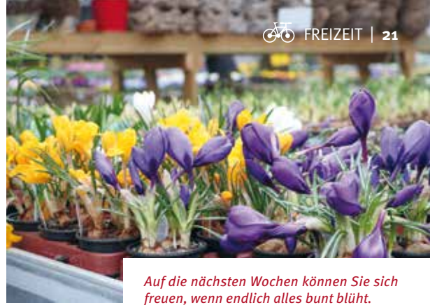
Auf die nächsten Wochen können Sie sich freuen, wenn endlich alles bunt blüht.

In den Sommermonaten soll man vor allem eines tun: sich am eigenen Garten und den Ergebnissen der harten Arbeit der vergangenen Monate erfreuen. Doch der Hobbygärtner sollte sich nicht ganz auf die faule Haut legen. Gießen, Düngen und Schneiden stehen auf dem Programm. Gerade an heißen Tagen braucht der Rasen viel Wasser und sollte mehrmals im Monat geschnitten werden. Verbringt man seinen Urlaub im heimischen Garten, kann nun die freie Zeit genutzt werden, um sich mit dem Thema Schädlingsbekämpfung zu beschäftigen. Denn kranke Pflanzen können auch wieder gesund gemacht werden. Nicht umsonst wird der Juli bei Hobbygärtnern auch als Blattlausmonat angesehen.