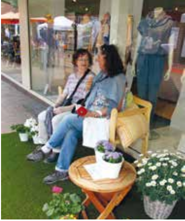
Die Bänke flüstern wieder am 5. und 6. Mai auf der Mittelstraße.