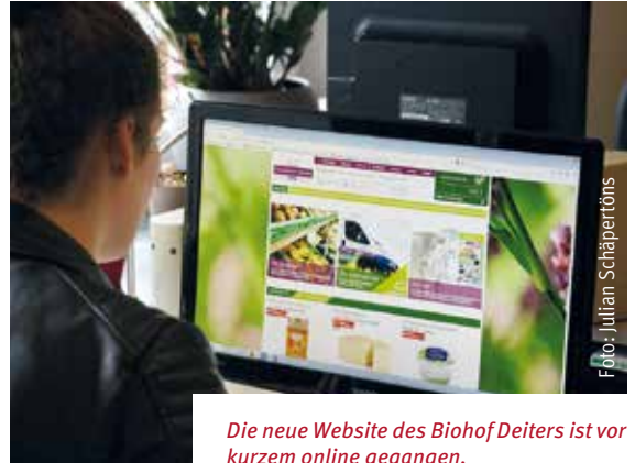
Die neue Website des Biohof Deiters ist vor kurzem online gegangen.

Schon einmal hinweisen möchte Simone Deiters-Schwerthöffer auf das Hoffest am Sonntag, 9. September. „Das ist zwar noch eine Weile hin, aber wir sind bereits in den Vorbereitungen und planen die Aussteller, Verkoster und Unterhaltung.“ Besucher des Hoffestes dürfen sich