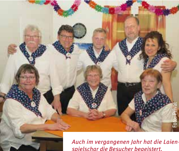
Auch im vergangenen Jahr hat die Laienspielschar die Besucher begeistert.

Die plattdeutsche Laienspielschar kommt mit einem neuen Stück zurück auf die Bühne