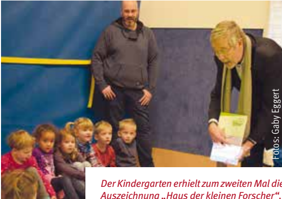
Der Kindergarten erhielt zum zweiten Mal die Auszeichnung „Haus der kleinen Forscher“.

Neugierige Kinder experimentieren in fünfmonatigem Projekt und erleben so das Thema Wasser hautnah