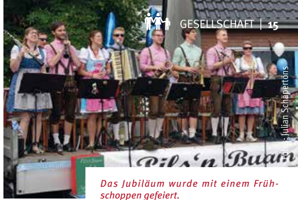
Das Jubiläum wurde mit einem Frühschoppen gefeiert.

Die Schermbecker Blasmusik-Band Pils'n Buam lud im September zu ihrem 15-jährigen Bestehen