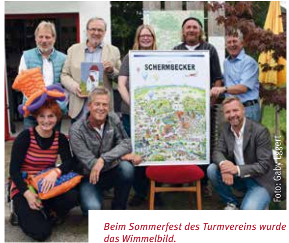
Beim Sommerfest des Turmvereins wurde das Wimmelbild.

Bürgermeister Mike Rexforth zeigt sich begeistert: „Das ist eine super Arbeit vor Ort in Damm. Ich möchte einmal Danke sagen. Der Turmverein Damm hat auch im neunten Jahr immer noch tolle Ideen. Das Poster ist ein Blickfang und wird sicherlich Geschichte schreiben.“ In Kürze wird „The Schermbecker“ in den Druck gehen. Eine weitere of-