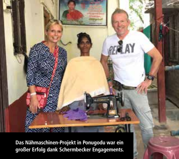
Das Nähmaschinen-Projekt in Ponugodu war ein großer Erfolg dank Schermbecker Engagements.