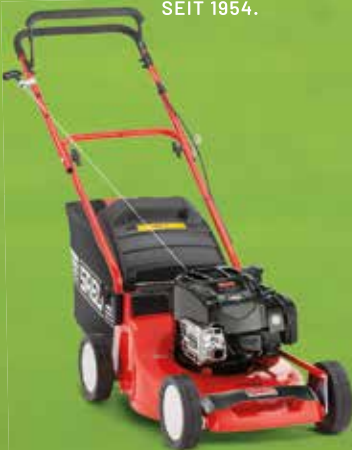
SABO 43-COMPACT SM