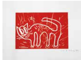
André Butzer, „KATZE“ SOS-Edition 2009, Auflage: 10 Farben, 10 verschiedene Katzen (100 Katzen), nummeriert und signiert, Linoldruck auf Papier, 50 x 65 cm

Mit dem Kauf eines limitierten Kunstwerks auf www.sos-edition.de unterstützen Sie Projekte der SOS-Kinderdörfer weltweit.