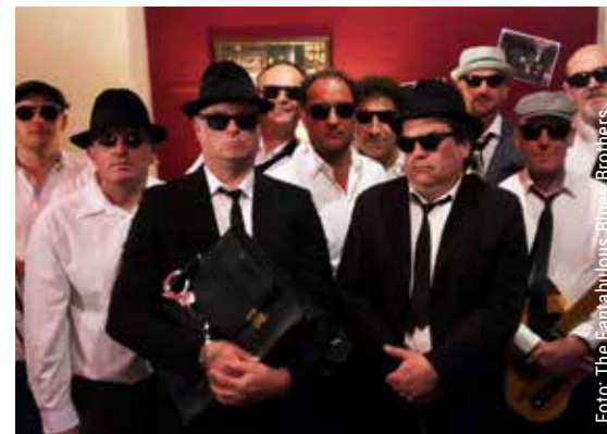
Foto: The Fantabulous Blues Brothers

... gehört gebührender Applaus, und zwar noch heute – „The Fantabulous Blues Brothers Band“ gastiert im Ramirez