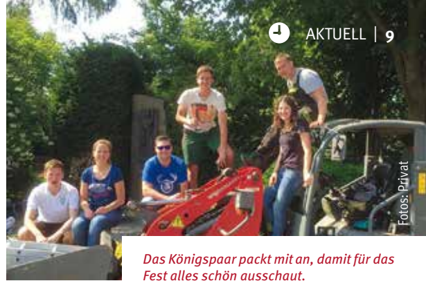
Das Königspaar packt mit an, damit für das Fest alles schön aussieht.

„Neben einer Hand im Beet durften wir die andere dauerhaft zum Grüßen hochhalten“, erzählte der König lachend. Sehr viele Vorbeifahrende hupten den Gartenarbeitern zu. Es ist zu spüren: „Langsam, aber sicher beginnt die Vorfreude aufs Traditionsfest im Dorf zu steigen.“ Am 30. Juni findet bereits die Vorfeier statt. Vom 14. bis zum 16. Juli ist dann das beliebte Schützenfest. Die Vorbereitungen für die geballte Ladung Tradition, die die Schermbecker in jedem Jahr am Kilianswochenende erleben, laufen auf Hochtouren. Die Vorstände beider Gilden haben sich bereits getroffen und einen feuchtfröhlichen Abend gefeiert, nachdem die wichtigsten organisatorischen Abläufe besprochen waren. Die LebensArt wird in der nächsten Ausgabe ausführlich darüber berichten.