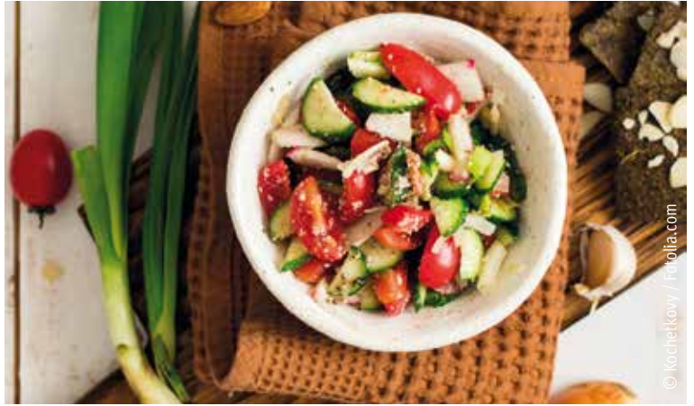
Bei den fruchtigen Sommersalaten ist alles erlaubt, was schmeckt!