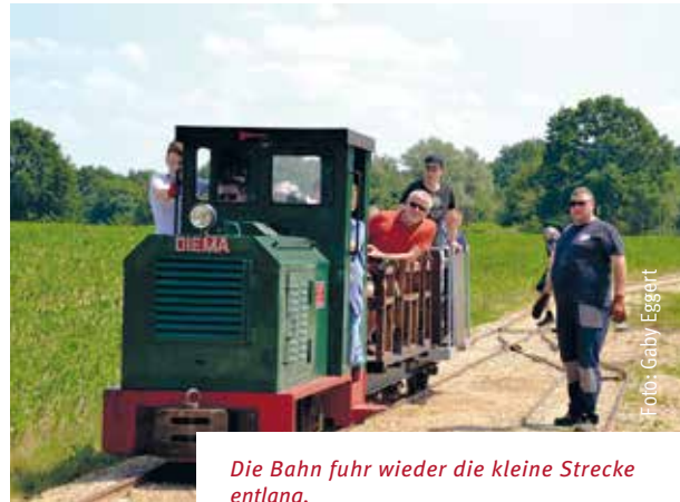
Die Bahn fuhr wieder die kleine Strecke entlang.

denn die Arbeit, die hier geleistet wird, ist ehrenamtlich. Übrigens können auch Gruppen, Kindergärten und Schulklassen die Feldbahnfreunde nach Anmeldung besuchen, viel über die heimische Tonindustrie erfahren und natürlich auch tuckernd und tutend durch die Landschaft fahren. ge